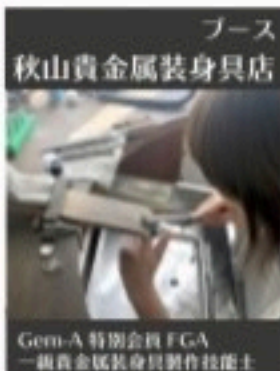
ブース 秋山貴金属装身具店 Gem-A 特別会員 FGA 一級貴金属装身具製作技師

縁側cafe世代の女性は、お若い頃から美しいジュエリーやお品の良い物に囲まれています。ジュエリーの整理整頓は難しそうですが、コツさえつかめば楽しく、今のお洒落にも活かれます。タンスの肥しをすっきり解決しましょう!